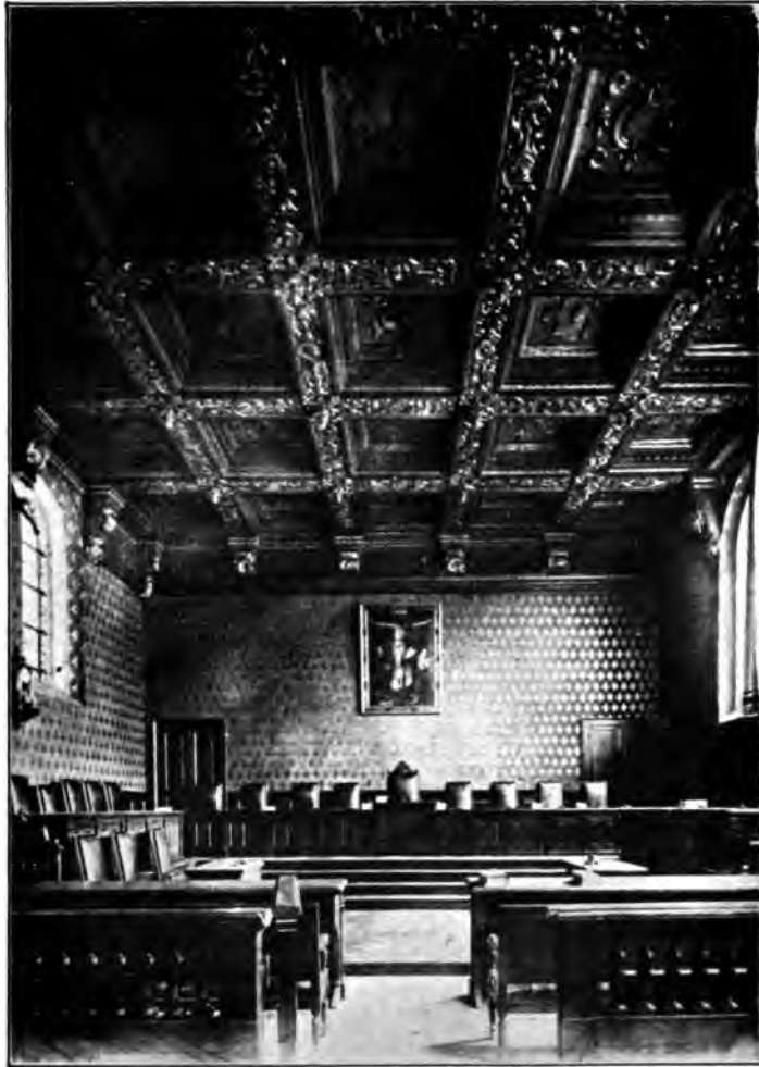
Chambre dorée du Palais.

Les autres chambres sont moins importantes que les précédentes, mais chacune d'elles renferme quelque curiosité. La Bibliothèque des avocats (ancienne Tournelle) a une haute cheminée qui porte la date de